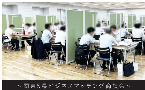
～関東5県ビジネスマッチング商談会～