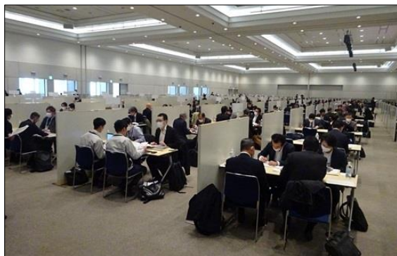
令和5年度に実施した「九都県市合同商談会2024」の商談風景 (会場: パシフィコ横浜 アネックスホール)

首都圏産業の国際競争力の強化を図るため、平成20年度から九都県市(埼玉県、千葉県、東京都、神奈川県、横浜市、川崎市、千葉市、さいたま市、相模原市)が連携して合同商談会を開催し、今回で17回目を迎えます。