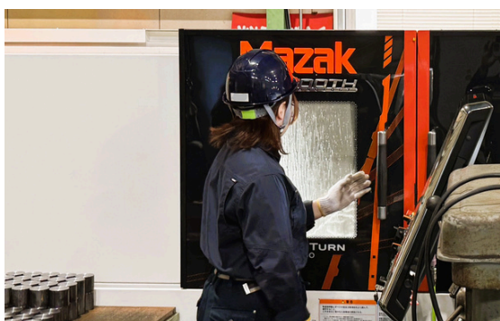
▲ 地元高校出身の社員が活躍

地元の高校にもしつこくしつこく通いましたね。今どきのように金髪もネイルもOK。一生懸命やってくれば何でもOKにして。そうしたら職場見学に来たいという連絡があったんです。