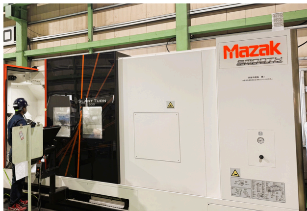
▲ ヤマザキマザック株のSLANT TURN500 加工サイズはΦ910×2000Lまで対応

アルミ鋳物や鉄鋳物（FC、FCD）などを取り扱っています。鋳物加工は先代の時から積極的に取り組んでいて、今では当社の製品の50%程度を占めているんですよ。