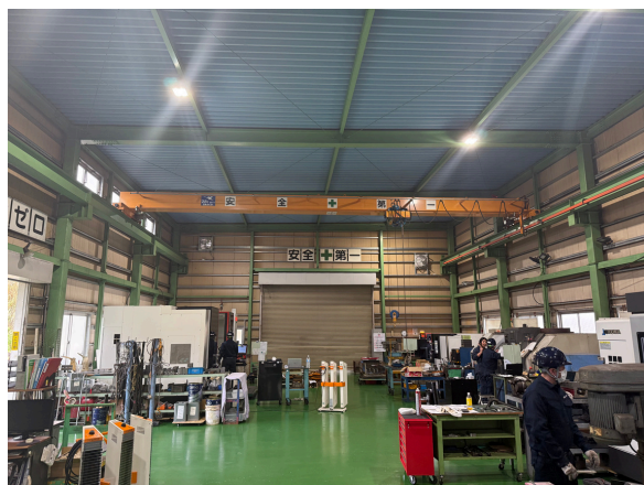
▲「本当に汚くてすごかった」という工場 現在は整然としており、5Sが徹底されていました

当時の工場は本当に汚くて、子どもの就職先としてここを見せられたらどれだけ落胆するだろうと親の立場になって想像してみました。それで、まずは中をきれいにする事から始めて「こんなマシンを使ってみよう」と思ってもらえるよう、補助金を活用して機械も新しくしました。イチかバチかの賭け。