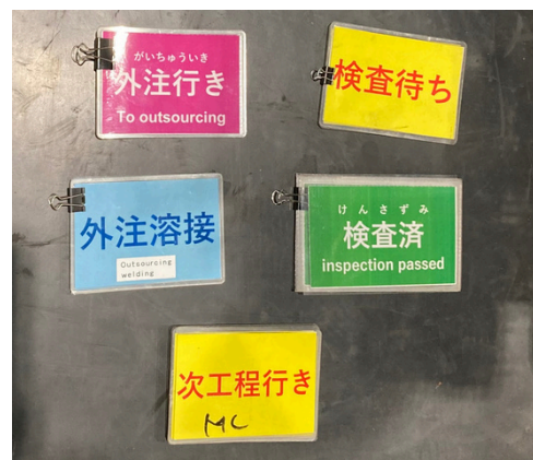
▲ オリジナル色分け工程カード 外国の方も勤務しているため、ひらがな・英語が併記されています

仕事中は真剣ですが休憩中は笑い声が絶えません。社員の誕生日会やBBQなどのイベントを企画しコミュニケーションを図る時間も頻りに作っているので、誰かが困っていると自然に声を掛け合える職場です。