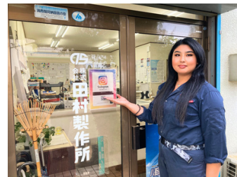
▲ インスタグラムもぜひご覧ください